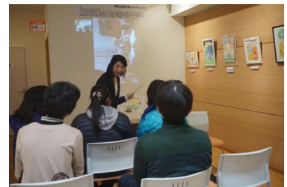
トークセッションの様子