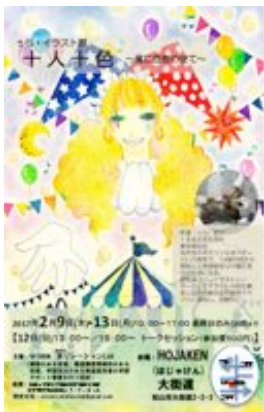
イラスト展案内ポスター